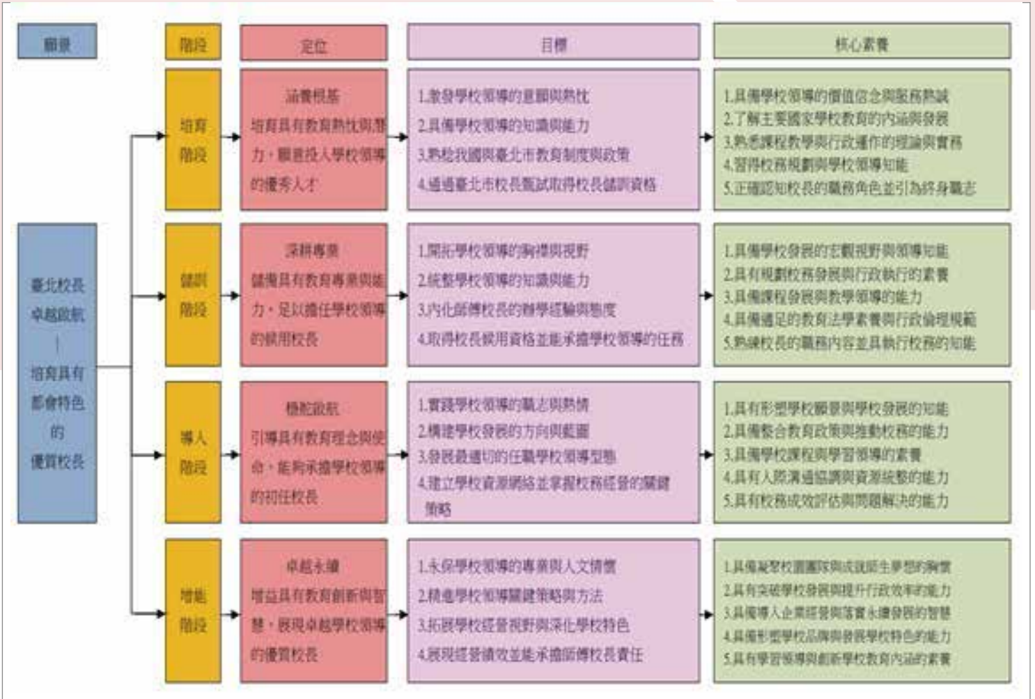
/圖1：臺北校長學－學校卓越領導人才培訓發展方案定位、目標、核心素養