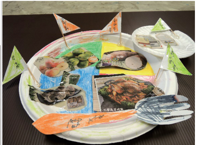
/學生作品-我的餐盤