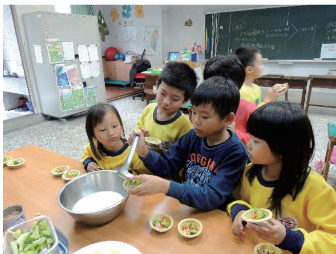
/我是大廚師 製作夢想塔