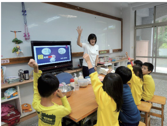
/學生熱烈參與課程活動