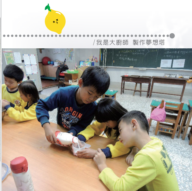
/我是大廚師 製作夢想塔