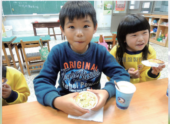
/開心品嚐自己做的夢想塔和奶茶